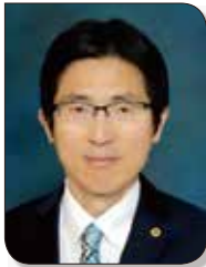
전라남도지사회 회장 이필수